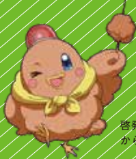
啓発キャラクター からぼと

こ えすえぬえす ぼうしひょうご ないよう つた 子どものSNSトラブル防止標語「とりのからあげ」 の内容を伝える どうが じゅう はっそう つく おうぼ ポスターデザインや動画をみなさんの自由な発想で作って応募してください!