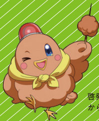
啓発キャラクター からぼと

こ えすえぬえす ぼうしひょうご ないよう つた 子どものSNSトラブル防止標語「とりのからあげ」の内容を伝える どうが じゅう はっそう つく おうぼ ポスターデザインや動画をみなさんの自由な発想で作って応募してください！