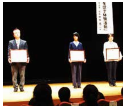
青少年及び育成活動等の顕彰