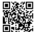
全国大会の様子はこちらから