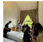
東部地区研修会 八頭町