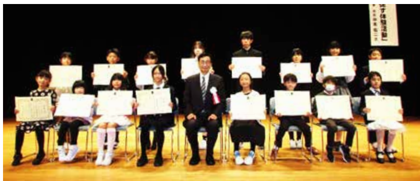
「家庭の日」絵画ポスターコンクール表彰式