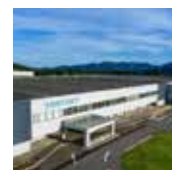
西部地区研修会 江府町