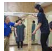
中部地区研修会 湯梨浜町