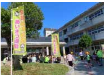
笑顔ピカピカあいさつ運動